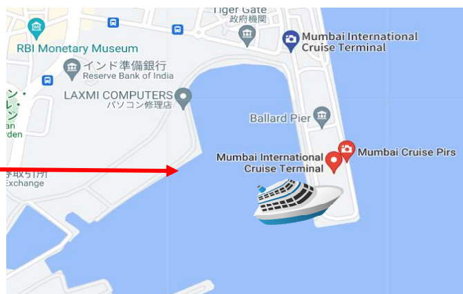
Mumbai International Cruise Terminal